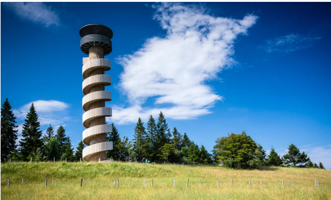
Tour de Moron

En parallèle, le projet de rapprochement avec les sections Croix-Rouge du Jura et de Berne va se mettre en route en ce début d'année. Le bulletin ASBJBJ permettra de tenir informé les membres de notre association de l'avancée des travaux menés par les différents groupes de travail.